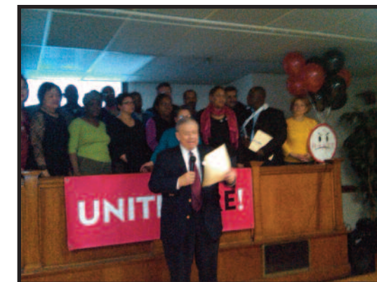
El 1 de abril, el presidente internacional del union John Wilhelm juró con los nuevos líderes del local 26.